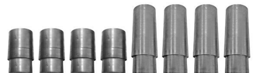
Adaptadores para furgonetas y camionetas.