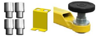
Almohadillas de tornillo, doble telescópicas y con adaptadores de aumento apilables.